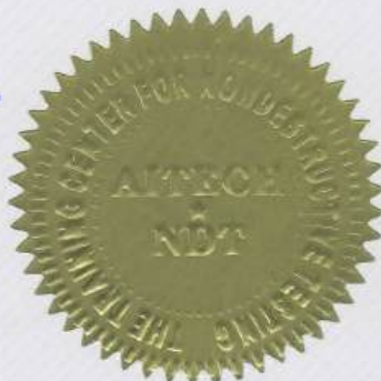
MAI ANH TAI ASNT Level III Cer. No: 204062